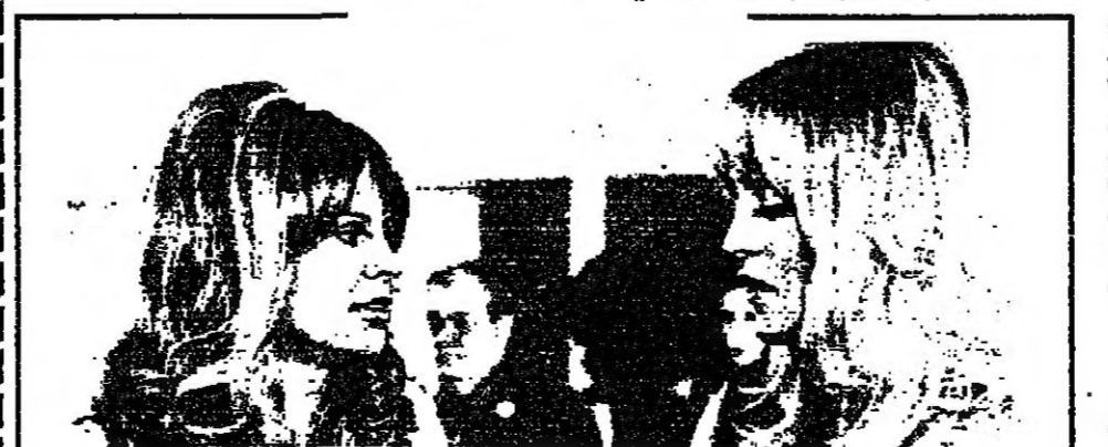
حوار تليفزيوني بين غولدي هاون ، وجولي كريستي

ما فعلته شركة بريطانية للخارج السينمائي منذ فيلمي « لورانس العرب » و«مدافع ناغرون» . وهناك عدد اخر من المثلث كانت لهم ادوار مهمة في الفيلم وهم وينستون تشورنا وجون كاني ورايك توكلي وكينيث كريكيت ورونالد فرايز واين يول واخيرا جاك وانسون . وقد اثر المخرج الاستمارة بستانشار في مشهور هو الكونويل مايك هاور لتعلمين الواتمية الفنية والطبيعية والمسكزية للمثلث . والكونويل هاور رئيس مجموعة المرتزة الذين عملوا في الكونغو ( زائير ) في العام 1966 . ولم يكن المنصر الاثني بيديا عن احداث الفيلم وادواره ، ريتشارد هاريس وزوجته الجميلة ان توركل بلعبان تورين بكل كل منهما الاخر : ميفرقة الفن وروعة الجلال . له من العمر 44 سنة ولها 25 سنة . اخضع الفن السينمائي لمفترقة ، فنجست هي مثل الازاة في الولايات المتحدة بعد ان شاركت في عدد من الافلام وسجلت بعض الاستوانات الموسيقية الكفائية الخاصة . بالاضافة الى كونها بصورة بارعة تعمل لعدد من الجلات الامريكية .